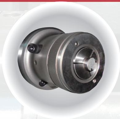
(選配) 筒夾套 A2-6 60# Collet chuck(opt.)