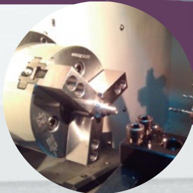
(選配) 5" 三爪夾頭 5" 3-Jaws hydraulic chuck (Opt.)